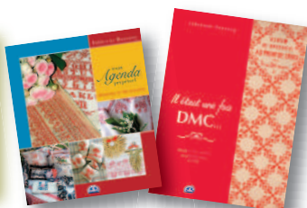
"Il était une fois" et "Agenda perpétuel" de F. Bassang

Pour toute inscription avant le 5 janvier, 2 magnifiques livres offerts :