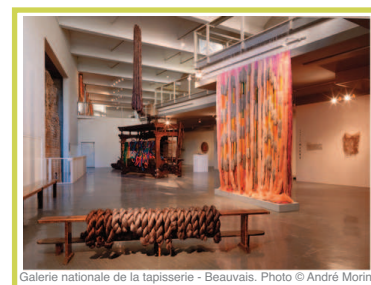
Galerie nationale de la tapisserie - Beauvais.

Pour vivre trois jours de rêve consacrés à la broderie et aux arts textiles, veuillez vite remplir le bulletin d'inscription ci-dessous